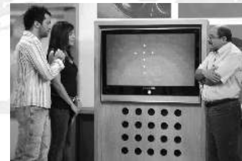
Momento de la entrevista en canal 13 de Santiago donde presentamos la Cruz formada por las esferas luminosas.