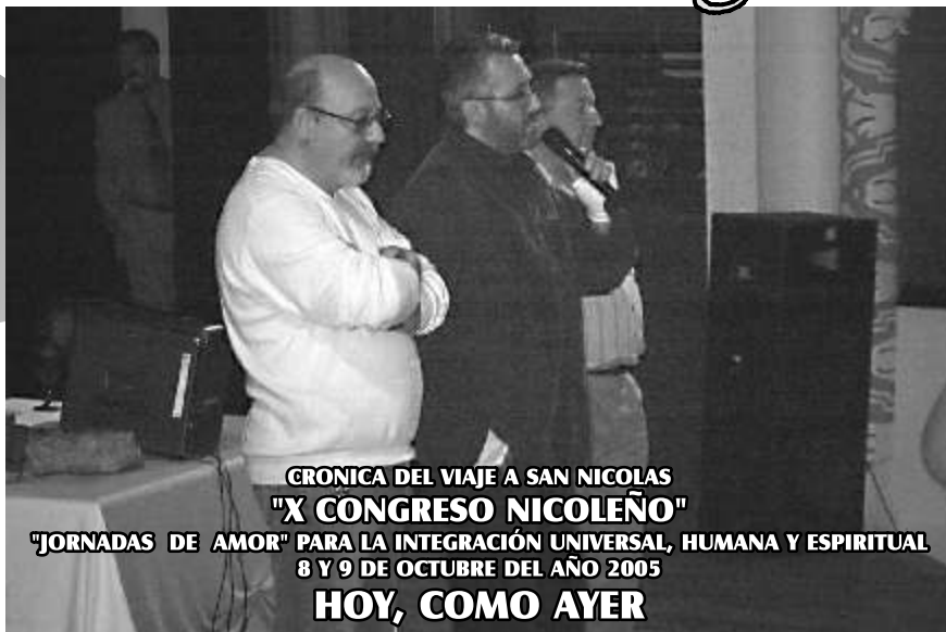
CRONICA DEL VIAJE A SAN NICOLAS "X CONGRESO NICOLEÑO" "JORNADAS DE AMOR" PARA LA INTEGRACIÓN UNIVERSAL, HUMANA Y ESPIRITUAL 8 Y 9 DE OCTUBRE DEL AÑO 2005 HOY, COMO AYER