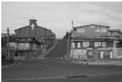
Vista de Las Ventanas, población donde visitamos a varias personas interesadas en la obra.