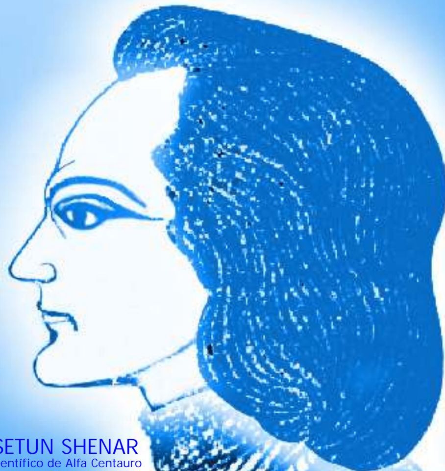
SETUN SHENAR Científico de Alfa Centauro

VISITA A CAPILLA DEL MONTE, UNA CRUZ DE LUZ EN LA FRENTE PREMIO POR ANTIMAFIA RECONOCE A GIORGIO BONGIOVANNI NACE LA REVISTA "DAL CIELO ALLA TERRA" EN ITALIA INFORME ESPECIAL: MEL NOEL