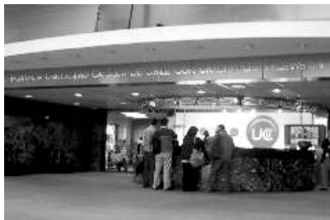
Pontificia Universidad Católica de Chile, Corporación de Televisión. Medio por el cual dimos a conocer la Cruz de esferas luminosas.