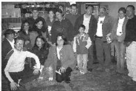
Momento de reunión en Las Ventanas, localidad a 40 km. de Viña del Mar.