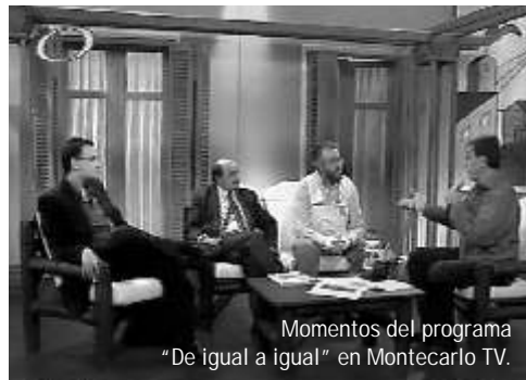
Momentos del programa "De igual a igual" en Montecarlo TV.