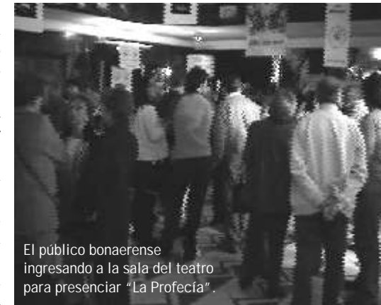
El público bonaerense ingresando a la sala del teatro para presenciar "La Profecía".