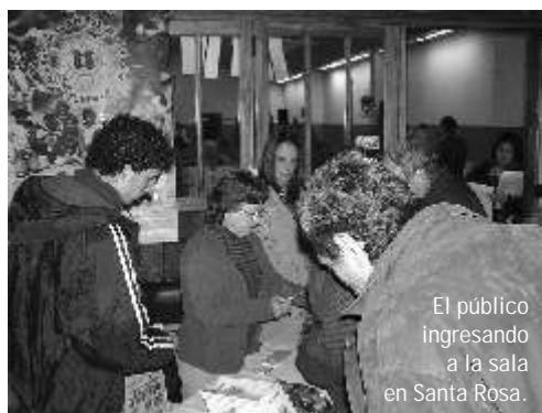
El público ingresando a la sala en Santa Rosa.