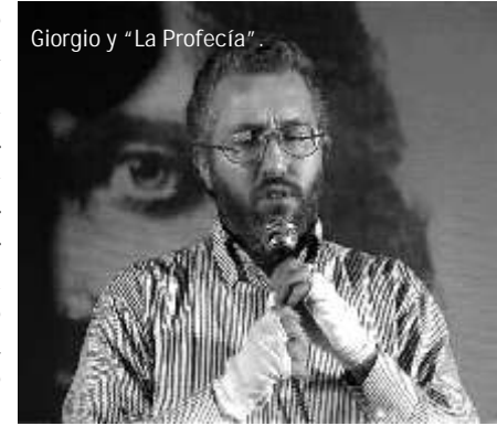
Giorgio y "La Profecía".

Erika Pais. 8 de mayo de 2006. Montevideo, Uruguay.