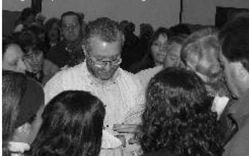
El inevitable final de cada encuentro con el público, la gente que se acerca al estigmatizado.