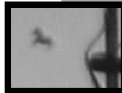
Imagen extraída del video grabado en octubre del 2005 donde se aprecia un caballo vivo, que es ascendido al cielo.