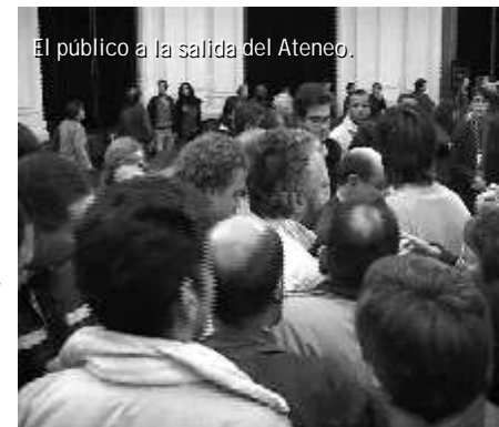
El público a la salida del Ateneo.