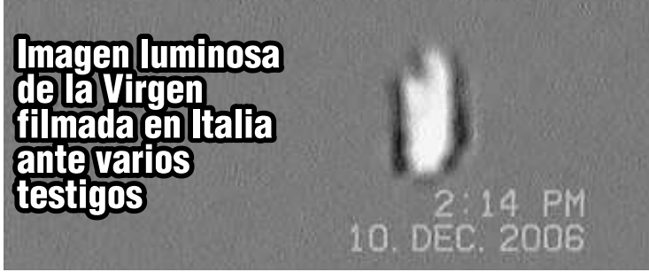
Imagen luminosa de la Virgen filmada en Italia ante varios testigos